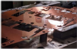
量産プレス製品 25tから300t、小さなものから大きなものまで、ご対応いたします。

津山市の鶴山公園はさくらの名所百選に数えられる約千本のさくらが咲く西日本有数のさくらの名所となっています。今年も3月23日から4月7日まで津山さくらまつりが開催されました。さくらの開花の遅れで4月14日まで延長されましたが、音楽ステージ、スターダストオーデション、鉄砲隊、花火など様々なイベントが開催されました。美作のご当地グルメの出店もあり、大人から子供までみんなで楽しめます。夜間ライトアップも行われ、夜桜も楽しめます。来年は、鶴山公園で春を満喫されてはいかがでしょう。