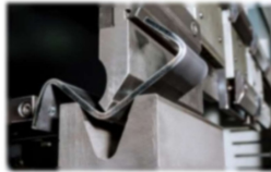
試作・板金製品 レーザーカット・板金加工で、製品1個から製作致します。